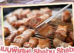
เมนูพิเศษ! Shabu Shabu และ BBQ สไตล์เกาหลี