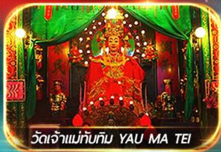
วัดเจ้าแม่ทับทิม YAU MA TEI