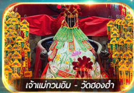
เจ้าแม่กวนอิม - วัดสองฮา