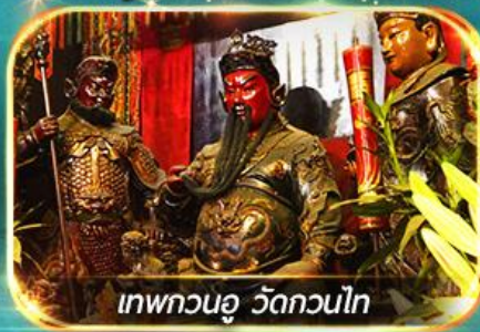
เทพกวนอู วัดกวนไท

พามูไหว้พระขอพร 8 วัดดัง, อิสระช้อปปิ้ง 1 วันเต็มแบบจุใจ