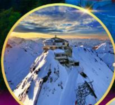
ยอดเขาซิลรอร์น