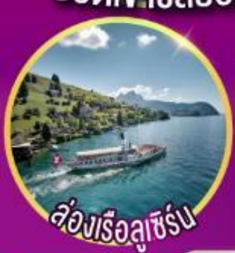
ล่องเรือลูเซิร์น