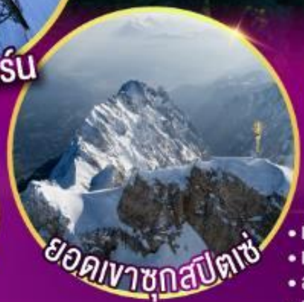
ยอดเขาชุกสปีตเซ