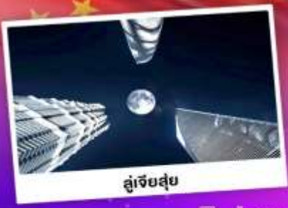
ดูเจ็ทสูย