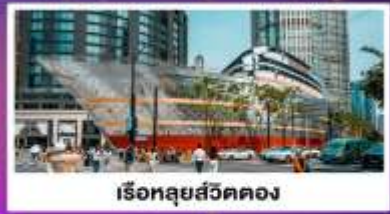
เรือหลุยส์วิตตอง