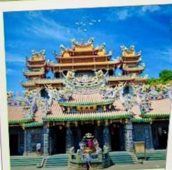
วัดกวนตุ๋