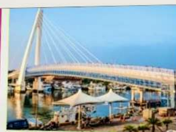
สะพานคู่รักตั้นสุ่ย