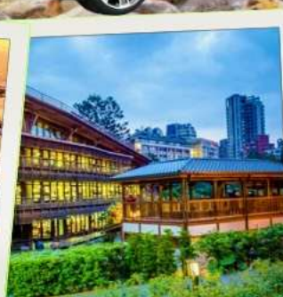
ห้องสมุดเป่ย์โถว