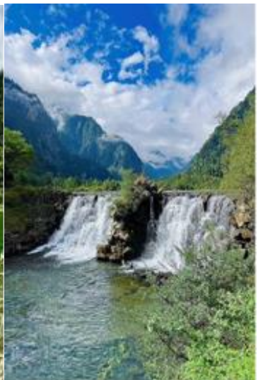
บ่าย จากนั้นนำท่านเดินทางสู่ เมืองตูเจียงเยียน (ใช้เวลาเดินทางประมาณ 3 ชั่วโมง) ซึ่งตั้งอยู่บริเวณที่ราบ

2UTFU-3U005 เฉิงตู...สี่ครุณี อุทยานป่ฝิงโกว ตูเจียงเยียน ร้านหนังสือจงซูเก๋อ 6วัน 5คืน โดยสายการบิน Sichuan Airlines (3U)