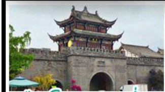
เมืองโบราณทวนเซี่ยน

ภูเขาสี่ดรุณี - อุทยานป่ฝิงโกว - สะพานหมานเฉียว - ร้านหนังสือจงซูเก๋ - เมืองโบราณกวนเสียน จตุรัสหยางเทียนหวู่ - หมีแพนด้าเซอเฟี - ถนนโบราณชอยกวางชอยแคบ - ถนนคนเดินไท่กู๋หลี่ ถนนคนเดินซุนซี - ถนนโบราณจินหลี่ - แพนด้ายักษ์ปิ่นตึก - น้ำพุไม้ไผ่ตึกSKP - วัดต้าอ้อ