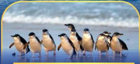
พาเหรดนกเพนกวิน