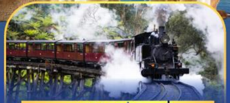
รถไฟพัพฟิงบิลลี่

ล่องเรือชมอ่าวซิดนีย์พร้อมรับประทานอาหารกลางวัน และ เข้าชมสวนสัตว์การองก้า