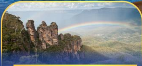
อุทยานแห่งชาติบลูเมาท์เทนส์ Three Sister Rock