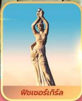
พีชเซอร์เกิร์ล