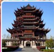
วัดดงหยวน