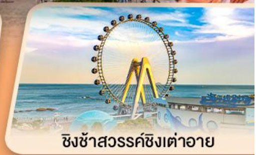
ชิงช้าสวรรค์ซิงต้าอายุ