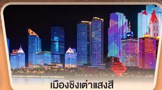
เมืองซิงต้าแสงสี