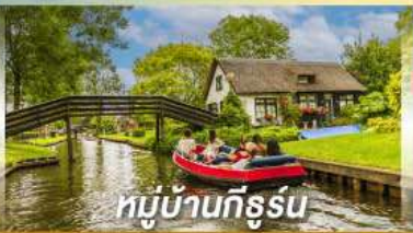
หมู่บ้านทีรูร์น