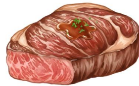
● ไม่ทานเนื้อหมู