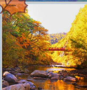
“JOZANKEI FUTAMI BRIDGE”