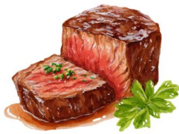
● ไม่ทานเนื้อวัว

ขอความกรุณาแจ้งวัตถุประสงค์ที่ท่าน แพ้หรือไม่สามารถรับประทานได้