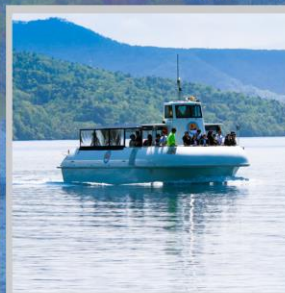
“LAKE SHIKOTSU GLASS BOAT”