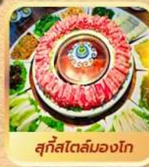
สุกีสโตล์มองโก