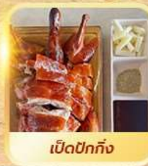
เปิดปาทัง