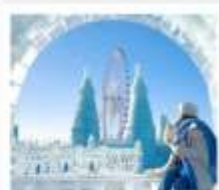
ICE & SNOW FEST.