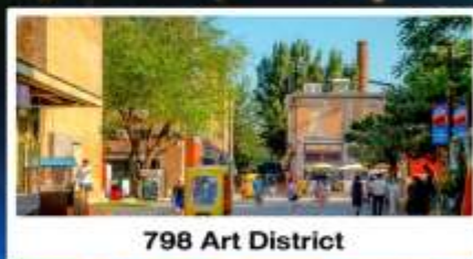
798 Art District