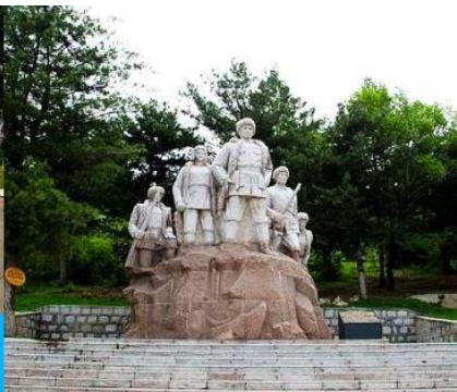
อนุสาวรีย์พิงหวง