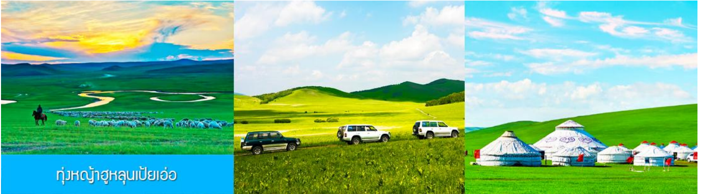
ทุ่งหญ้าฮูลุนเปียวเอ๋อ