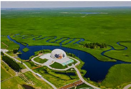
อุทยานชุ่มชื้นจาหลง

รับประทานอาหารเช้า ณ ห้องอาหารของโรงแรม (7)