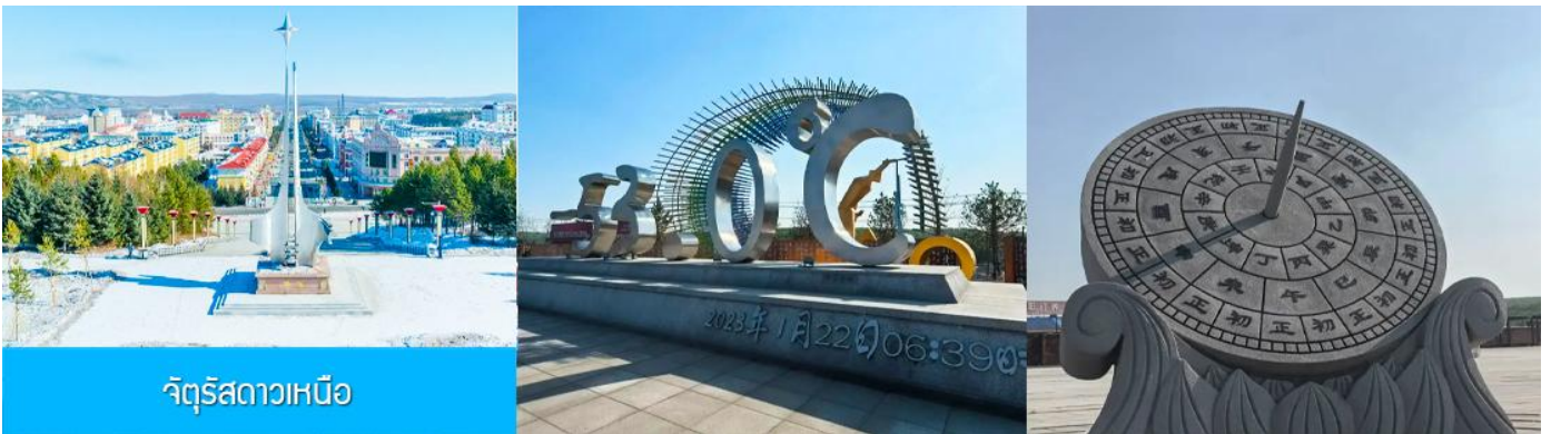
จัตุรัสดาวเหนือ