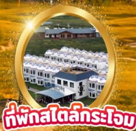
ที่พักสไตล์กระโจม