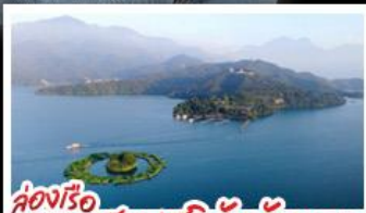
ส่องเรือทะเลสาบสุริยันจันทรา