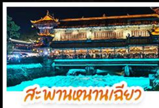
สะพานเสฉวนเจียว