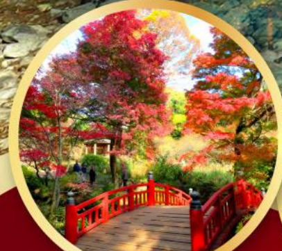
สวนดอกบ๊วยอาตามิ