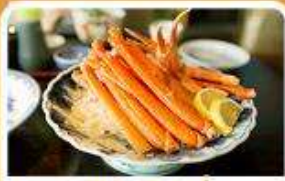
พิเศษ! ชาบู