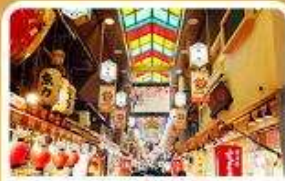
ตลาดปลาชิชิ