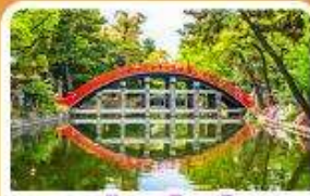
ศาลเจ้าสุมิโยชิ โทคะ