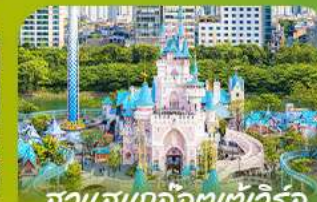
สวนสนุกลิตต์เอเดิเจอร์ล Lotte Adventure World