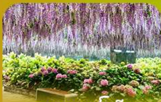
สวนนกเปาเม็ย