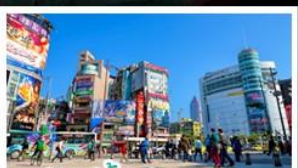
ซ้อปิ้งซีเหมินตง