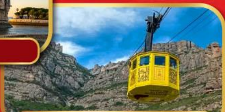
ขึ้นกระเช้าอารามมอนต์เซอร์ริต