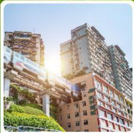
รถไฟกะลุดัก

ไฮไลท์! เมืองโบราณกลางถ้ำ ล่องเรือแม่น้ำอูเจียง อุทยานถ้ำอาผยอง รถไฟกะลุดัก หมู่บ้านโบราณฉือซีโซ่ ดนบคนเดินเรือฟางเปีย