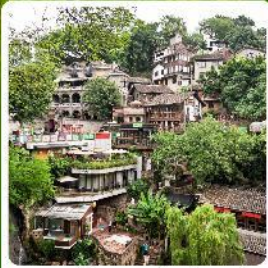
ตรอกโบราณเซี่ยฮ่าวหลี่