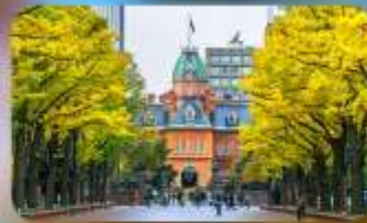
อัสระ-ตามอัสระยาศัย 1 วัน