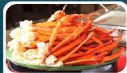
ชาบูบุฟเฟ่ต์