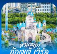
สวนสนุก ล็อดดะตึ เวิร์ลด์