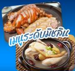
เมนูระดับมิชลิน

เที่ยวชม 3 เมืองฮิต โซล - แทกู - ปูซาน สัมผัสเสน่ห์เกาหลีหลากหลายสไตล์ • ชมพระราชมิ่งเคียงบกกุง ตึก Lotte World Tower พร้อมจุดชมวิว Seoul Sky ในกรุงโซล • ช้อปปิ้งถนน Art Street ตามรอย BTS ตลาดชอมนุน • แลนด์มาร์ก 83 Tower ที่แทกู • ปักถ่ายที่ปูซานกับวัดแควดงยงกุงซา หมู่บ้านวัฒนธรรมคิมซอน โซลที่นั่งรถไฟสายกายแปงชุลซงวึงทะเลสุดประทับใจ • เดินทางสะดวกด้วยรถไฟความเร็วสูง KTX อิมอร้อยกับเมนูพิเศษ จากเกาหลีและได้คู่ปัสเปรมะดับมิชลิน เก็บครบทุกความประทับใจในทริปเดียว