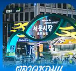
ตลาดชอมนุน