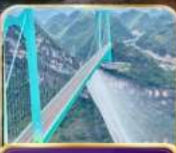
สะพานฮวาเกียง