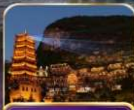
หมู่บ้านโบราณเฟิงหลินบู้อี้ (รวมรถแบค)

คุนหมิง ซิงอี้ เมืองโบราณเฟิงบู้อี้ อุทยานป่าภูเขามินหยอด 6 วัน 5 คืน