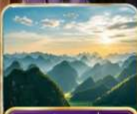
อุทยานป่าภูเขามินหยอด (รวมรถแบคเตอร์ )