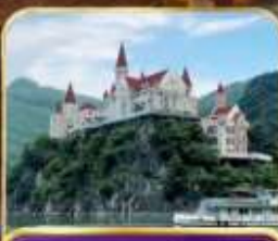
ล่องทะเลสาบวานเฟิงหู