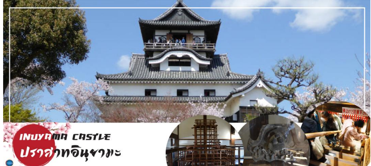
INUYAMA CASTLE ปราสาทอินยามะ

นำท่าน เข้าชม ปราสาทอินยามะ (Inuyama Castle) ตั้งอยู่ใจกลางเมืองอินยามะ ทางตะวันตกเฉียงเหนือของจังหวัดไอจิ ประเทศญี่ปุ่น เป็นปราสาทที่สร้างขึ้นในตอนปลายศตวรรษที่ 16 ที่อยู่รอดมาจนถึงปัจจุบัน ปราสาทแห่งนี้มีความพิเศษตรงที่มีหอคอยที่มีความเก่าแก่ที่สุดในประเทศ ดังนั้นปราสาทแห่งนี้จึงได้รับการประกาศให้เป็นสมบัติของชาติ ด้านในของปราสาทมีการจัดแสดงอาวุธในการทำสงครามในสมัยต่าง ๆ ของญี่ปุ่น และเราสามารถเดินขึ้นไปด้านบนเพื่อชมความงามของตัวเมืองอินยามะ ตลอดจนแม่น้ำคิโซะ และที่ราบโนบิได้