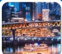
"ล่องเรือชมหงหยาดัง"