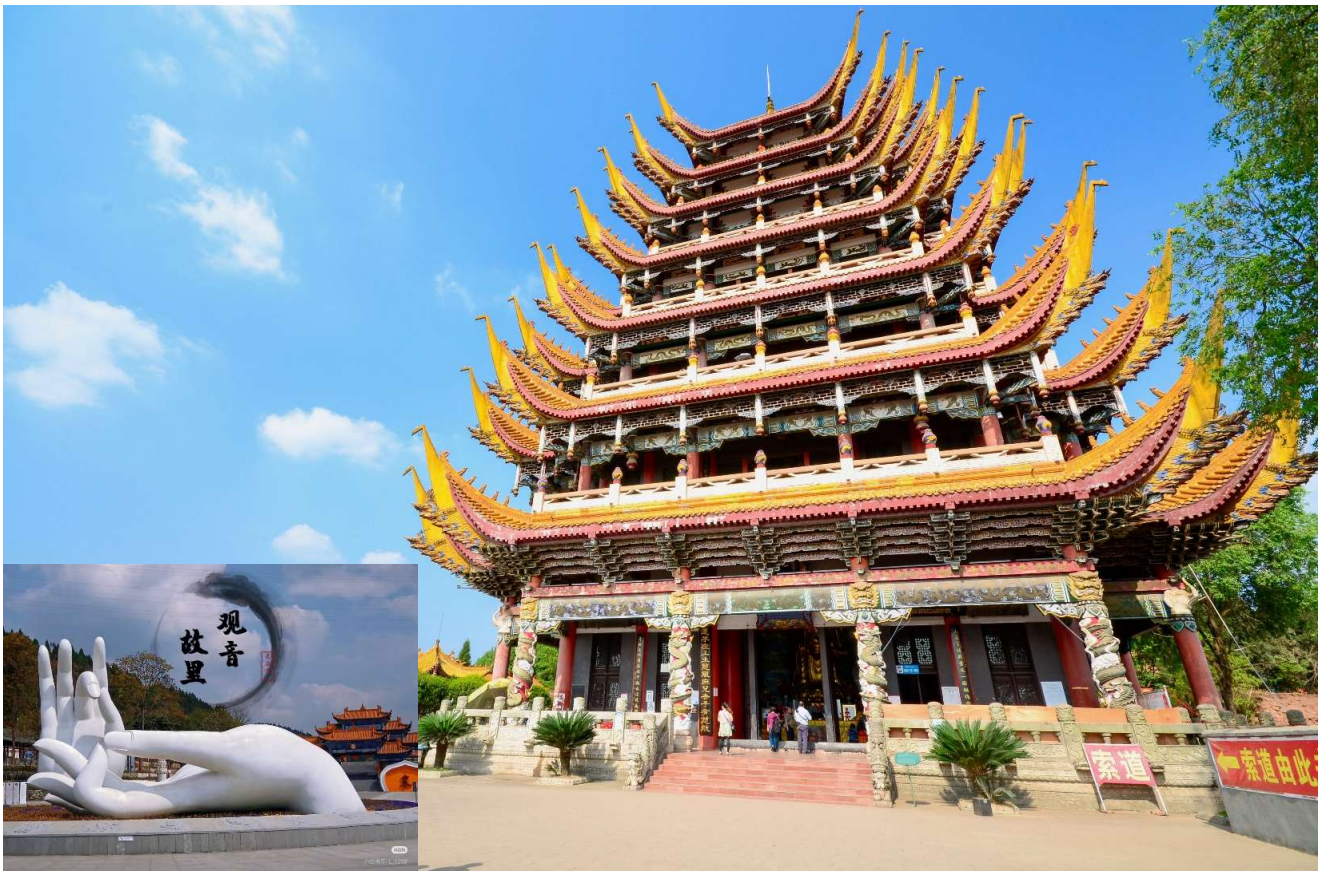
T2G-CKG36FD ฉงชิ่ง กวางอู่ชาน...วัดหลิงฉวน ต้าจู่ ชมถนนแปะก๊วย 5D 4N (FD)

จากนั้นนำท่านเดินทางสู่ วัดหลิงฉวน (Lingquan Temple) หรือ วัดเจ้าแม่กวนอิมกระพริบตา เป็นวัดเก่าแก่ซึ่งสร้างขึ้นในปลายราชวงศ์สุย (ค.ศ. 581 - 618) และบูรณะพัฒนาต่อเนื่องมา มีความเชื่อว่าเป็นวัดที่มีความศักดิ์สิทธิ์อย่างมาก มีเรื่องเล่ากันว่า เมื่อครั้งเกิดแผ่นดินไหวที่มณฑลเสฉวน ชาวบ้านที่มาสักการะเห็นเจ้าแม่องค์นี้ได้กระพริบตาและหลั่งน้ำตา เสมือนท่านสงสารชาวผู้ประสบภัย ภายในวัดแห่งนี้ยังได้แสดงประวัติของเจ้าแม่กวนอิม วิหารเจ้าแม่กวนอิม ภายในวิหารเจ้าแม่กวนอิม มีองค์เจ้าแม่กวนอิมยืนสูง 18.6 เมตร