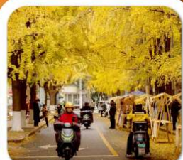
"ถนนแปะก๊วย"

นั่งกระเช้าชมภูเขาหวงอู่ซาน ขุนเขาใบไม้แดงอันดับหนึ่งของประเทศจีน เมืองชู่หยหนิง วัดหลิงจวน (วัดเจ้าแม่กวนอิมกะพริบตา) - พาสินแกะสลักต้าจู้ หงหยาดัง ถนนแปะก๊วย ดึกตะเกียบ วัดหลัวซัน ล่องเรือชมวิวฉงชิ่ง