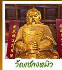
วัดเข่งงหมิว