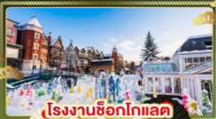
🏨 โรงงานช็อกโกแลต ชิโร โคอิจิโต๊ะ