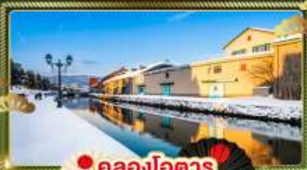
♨️ คลองโอตารุ

ออกทัวร์ ดินแดนหิมะในฝัน เซ็คอินลานสกีสุดฮิต ซัปโปโรวินิลท่ามกลางหิมะ