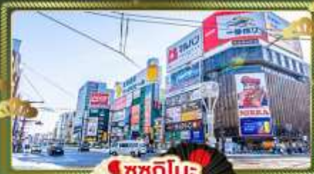
🏙️ ซูซุกิโมะ