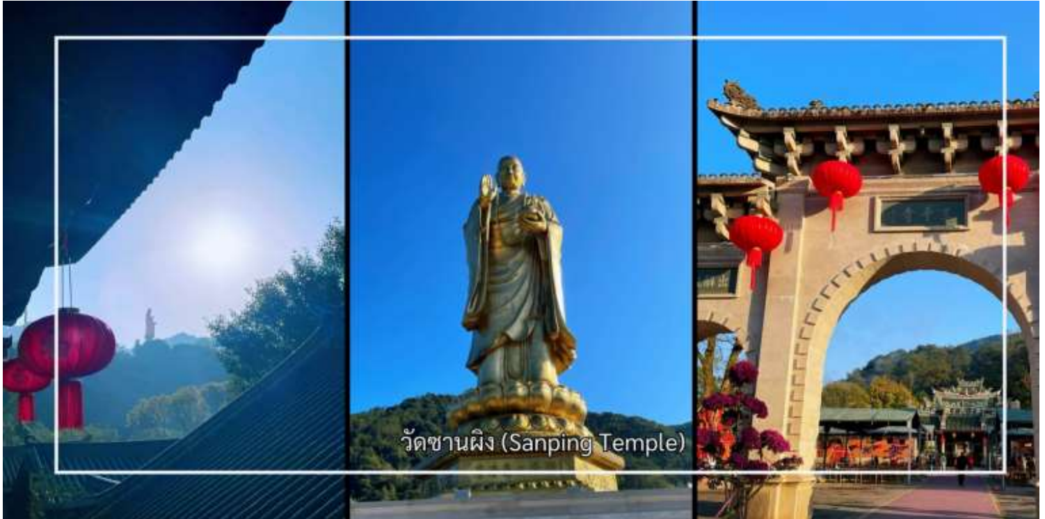
วัดซานผิง (Sanping Temple)

หลังอาหารเช้านำท่านเดินทางสู่ เมืองจิ้งโจว (Zhangzhou) เมืองสำคัญทางประวัติศาสตร์และวัฒนธรรม เมืองแห่งนี้มีประวัติความเป็นมายาวนาน และมีบทบาทสำคัญในฐานะศูนย์กลางการค้า การคมนาคม และการแลกเปลี่ยนวัฒนธรรม นำท่านสู่ วัดซานผิง (Sanping Temple) เมืองจิ้งโจว วัดพุทธที่มีความสำคัญทางประวัติศาสตร์และเป็นที่ยึดเหนี่ยวจิตใจอย่างสูงของพุทธศาสนิกชน วัดแห่งนี้มีชื่อเสียงในฐานะศูนย์รวมแห่งศรัทธาและเป็นสถานที่ปฏิบัติธรรมที่สืบทอดมาอย่างยาวนาน วัดซานผิงโดดเด่นด้วยบรรยากาศอันสงบ ร่มรื่น รายล้อมด้วยธรรมชาติและสถาปัตยกรรมจีนดั้งเดิมอันงดงามผู้มาเยือนสามารถสักการะสิ่งศักดิ์สิทธิ์ เรียนรู้ประวัติความเป็นมาของวัด และสัมผัสถึงความสงบทางจิตใจ