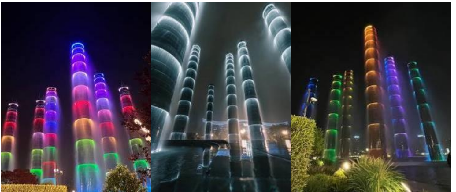
นำท่านชม ไฟน้ำพุไม้ไฟตึกSKP แสงสียามค่ำคืนที่ ลานห้างสรรพสินค้า SKP แลนด์มาร์คแห่งใหม่

2UTFU-MU003 เฉิงตู...ตะลุย3อุทยาน อุทยานปืเผิงโกว อุทยานต้ากู่ปิงชวน อุทยานสี่ตรุณี *ไม่ลงร้านช้อปปิ้ง* 6วัน 5คืน โดยสายการบิน China Eastern Airlines (MU)