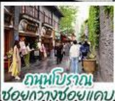
ถนนโบราณ ชอยกวางชอยแคบ