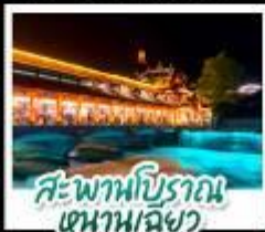
สะพานโบราณ หนานเฉียว