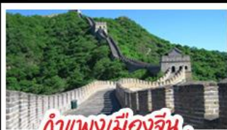
กำแพงเมืองจีน ด่านมู่เทียนยวี่

Universal Beijing - กำแพงเมืองจีนด่านมู่เทียนยวี่ (รวมกระเช้าขึ้น-ลง) พระราชวังโบราณกู้กง - หอฟ้าเทียนถาน - ซุปป์ิงถนนหวิงฝูจิ่ง และซานหลี่กุน เมนูพิเศษ สุกี่มองโก, เป็ดปักกิ่ง, Michelin Guide ร้าน Tao Tao Ju