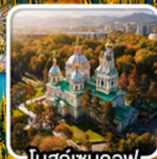
โบสถ์เซนคอฟ

นั่งกระเช้าคอนโดล่าขึ้นสู่ชิมบูลัก สตรีสออร์ก ไร่มุกแห่งเทือกเขาเทียนชาน ทะเลสาบโคลโซ หุบเขาเจดี โอกูช / ภูเขาหินเทพนิยาย / ทะเลสาบอัสซิกกุล ชมการแสดงการล่าเหยื่อของนกอันทรี