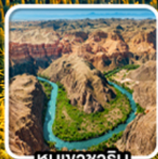
หุบเขาซาริน