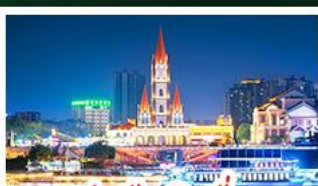
ท่าเรือกิ่งจื่อ

เขาชิงช้าสวนดอกไม้ตามฤดูกาล หมู่บ้านสไตล์ยุโรปเที่ยงวัน มังซิง เสี่ยวเจิน ถนนคนเดิน NANNING ZHIYE - เมืองโบราณไท่ผิง ท่าเรือกิ่งจื่อ - ถนนคนเดิน สามตรอกสองซอย