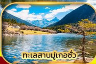
ทะเลสาบมู่เกอซัว