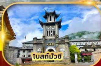
โบสถ์บ๊วย