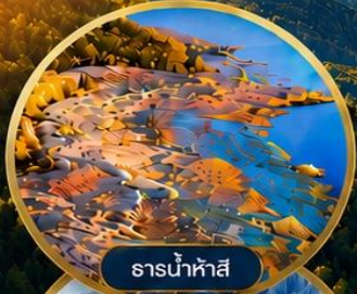
ธารน้ำห่าสือ