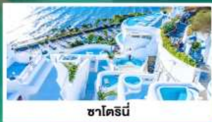
ซาไดร์นี่