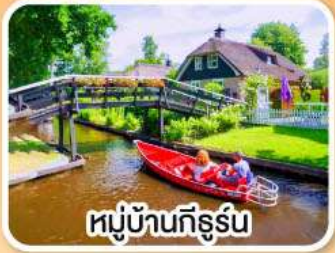
หมู่บ้านทีร์ูร์น