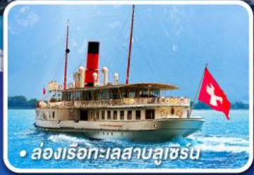
• ล่องเรือทะเลสาบลูซีร์น