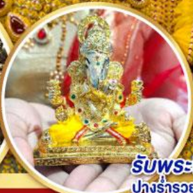
รับพระพิฆเนศวร ปางรำรอย ท่านละ 1 องค์