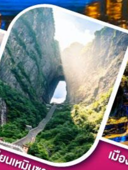
เวาเทียนเหมินชาน