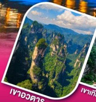
เวาอวตาร