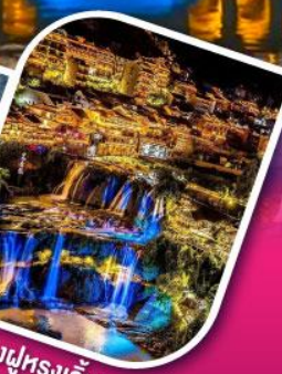
เมืองผู่หลงเจิ้น