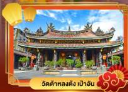
วัดต้าหลงตั้ง เป่าอัน